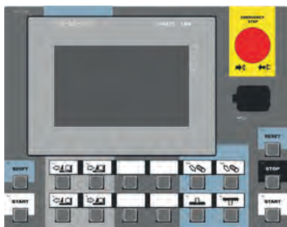
CONTROL PANEL: SIEMENS (X)